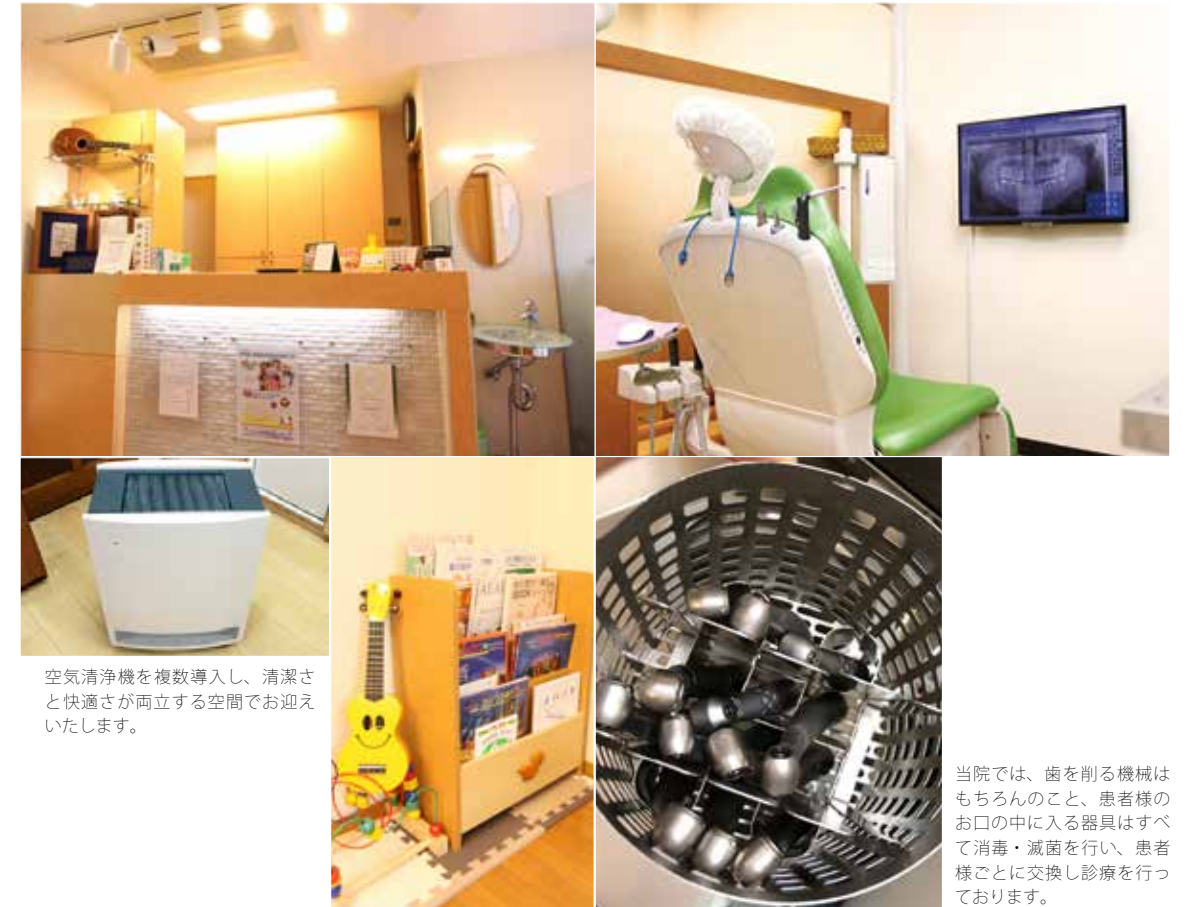
空気清浄機を複数導入し、清潔さと快適さが両立する空間でお迎えいたします。