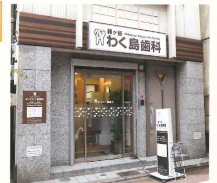
駅から約5分、六号坂通り商店街に位置する同院

診療内容: 一般歯科 / 小児歯科 / 歯科口腔外科 / 矯正歯科 / 予防歯科 / 審美歯科 / ホワイトニング / 義歯・入れ歯 / インプラント / かみ合わせ治療